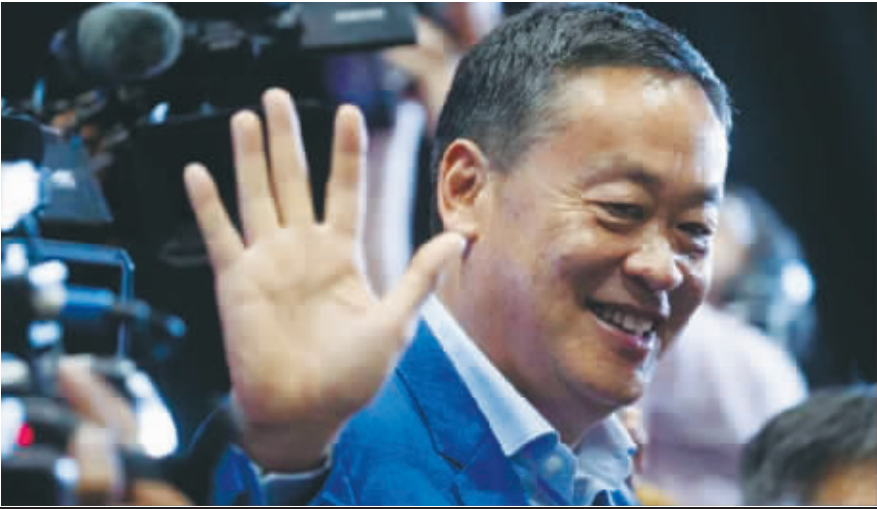
在为泰党总部举行的新闻发布会上,为泰党总理候选人赛塔在离开时挥手致意。

当地时间8月3日13时,泰国为泰党副党魁普探接受媒体采访时表示,鉴于当日早些时候,国会主席万诺宣布推迟原定8月4日举行的第三轮总理选举投票。