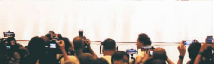
当地时间2023年5月22日,泰国8个政党就组建联合政府签署谅解备忘录。