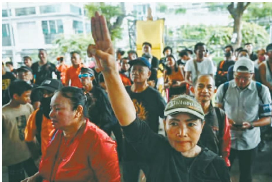
当地时间2023年8月2日,远进党支持者聚集在曼谷为泰党总部外抗议。

为泰党副领导人表示,由其政党领导的政府不会支持修改刑法第112条,将专注于解决经济和政治问题。