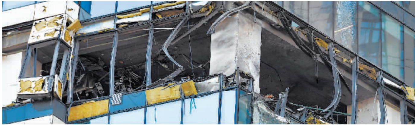
在俄罗斯莫斯科拍摄的被无人机袭击的建筑。

俄罗斯首都莫斯科市中心7月30日和8月1日两度遭乌克兰无人机袭击。乌克兰一些重要地点近来也不断成为俄军无人机的攻击目标。无人机频繁袭扰莫斯科,表明乌方“无人机战”能力提升,双方互攻今后可能升级加剧。虽然无人机袭击带来的损失不大,但莫斯科防空体系却承压不小。