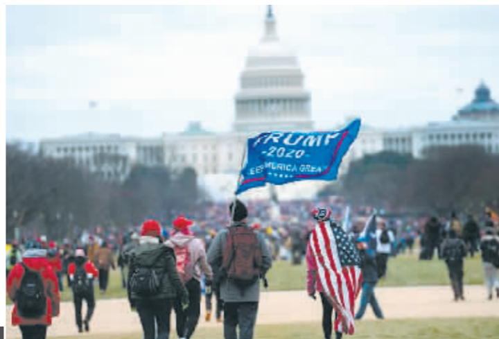
2021年1月6日,在美国首都华盛顿,时任美国总统特朗普的支持者举行示威游行。