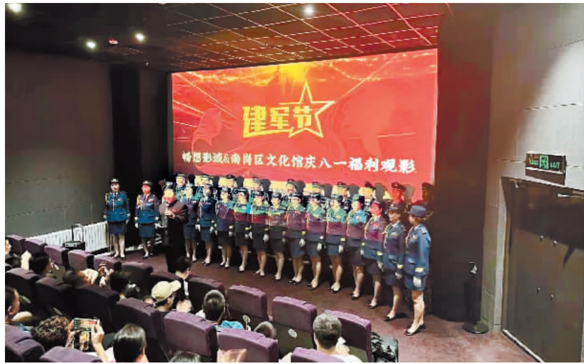
活动现场唱响军歌。

本报讯(王兴国 记者 梁可心)为庆祝中国人民解放军建军96周年,近日,南岗区文化馆携手畅想影城城工大店举办了一场公益观影活动。电影放映前,观众们还意外欣赏到唱军歌快闪表演,令建军节庆祝氛围更加浓厚。