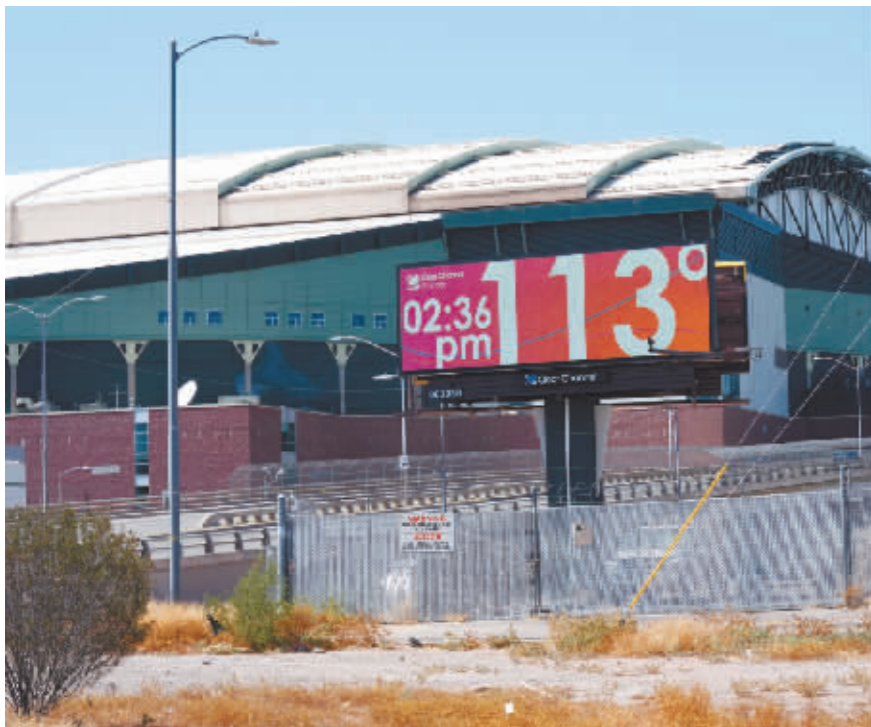
7月18日,凤凰城一温度显示屏显示温度为113华氏度(45摄氏度)。

据新华社电 美国西南部多地遭受高温炙烤,亚利桑那州首府凤凰城已连续一个月最高气温超过43摄氏度,远超过半个世纪前创下的纪录。