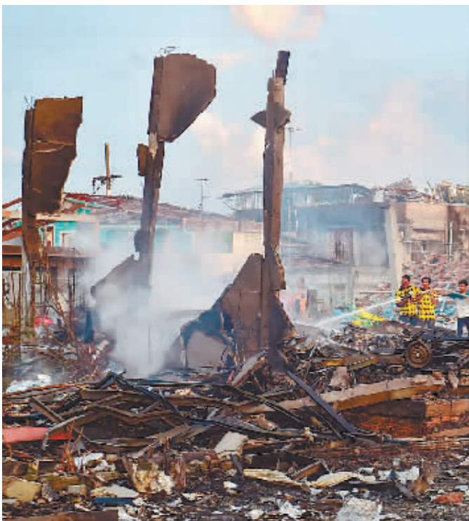
7月29日,消防人员在泰国南部那拉提瓦府发生爆炸的烟花爆竹仓库现场灭火。

据新华社电 泰国南部毗邻马来西亚的那拉提瓦府哥乐河镇一座非法储存烟花爆竹的仓库29日下午发生剧烈爆炸,截至30日白天,已造成至少10人死亡、约120人受伤,周边大片房屋被夷为平地。爆炸起因尚未确认,初步调查显示可能是仓库所在建筑施工中的焊接作业出了问题。