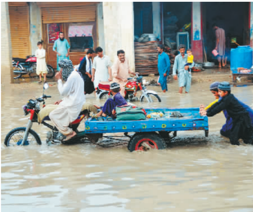
7月27日,人们在巴基斯坦俾路支省积水的道路上涉水出行。

新华社伊斯兰堡7月30日电 巴基斯坦国家灾害管理局29日发布报告说,6月25日以来,强降雨引发的洪水已在该国造成至少173人死亡,260人受伤。