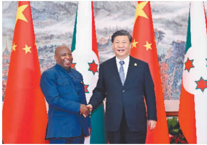
7月28日下午,国家主席习近平在成都会见来华出席第31届世界大学生夏季运动会开幕式并访华的布隆迪总统恩达伊施米耶。

会见后,两国元首共同见证签署《中华人民共和国政府与毛里塔尼亚伊斯兰共和国政府关于共同推进“一带一路”建设的合作规划》。蔡奇、丁薛祥、王毅、谌贻琴等参加上述活动。