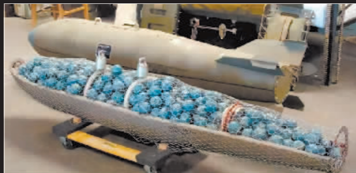
一颗集束炸弹内可包含几十到几百枚不等的子弹药。

2001年12月19日,阿富汗托拉博拉地区的一群村民为一个被集束炸弹炸死的22岁年轻人送葬。这名年轻人在拾柴火的时候被一枚集束炸弹炸死。