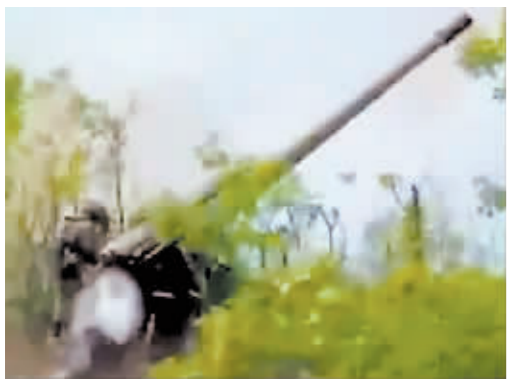
俄军打击乌方目标。

乌克兰媒体23日报道称,乌总统泽连斯基当天在其官方社交媒体上表示,将就俄军对敖德萨的袭击作出回应。乌克兰空军当天发布消息称,俄军当天凌晨从克里米亚和黑海使用19枚各型导弹袭击了敖德萨,乌克兰摧毁了其中9枚导弹。乌克兰独立新闻社报道称,泽连斯基23日在Telegram上称,“导弹针对和平城市、住宅楼和大教堂……俄罗斯的恶行没有任何借口,这种恶行将一如既往地失败。俄罗斯恐怖分子肯定会因(袭击)敖德萨遭到报复。”泽连斯基还称,“所有受最近一次恐怖袭击影响的民众都将得到帮助。我感谢所有帮助当地民众的那些人,以及在情感上心与敖德萨同在的人,我们会渡过难关的。我们将重返和平。为此,我们必须战胜俄罗斯的恶行”。