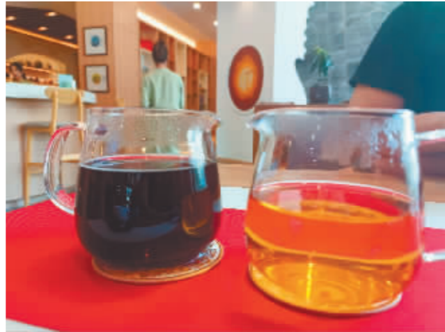
普洱生茶和普洱熟茶有着不同的颜色。