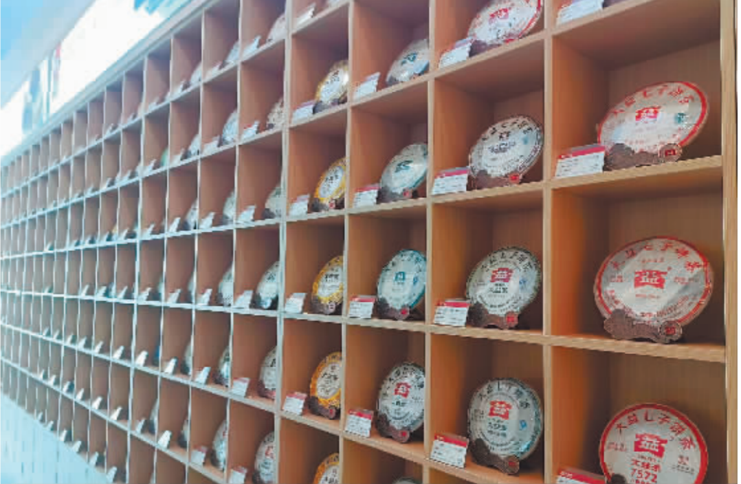
哈市茶叶销售门店储存的老茶。