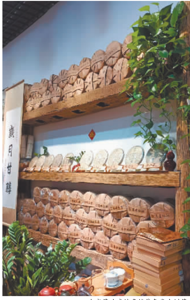
哈市茶叶店储存销售各类古树茶。