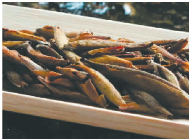
售价15万元一斤的古树茶茶叶。

说起老茶收藏的财富效应,受访的藏友和从业者都不约而同地提到了88青饼的故事。其实,88青饼是国营勐海茶厂于上世纪八十年代后期生产的一批普洱生茶茶饼的统称。这批茶生产出来后正赶上市场上普洱茶销路不畅,就一直积压在茶厂仓库中。有人以每饼几元钱的价格把这些茶全部买下,并以吉祥的数字88为这些茶饼命名。由于长期妥善的贮存让这批茶口感极佳,加上市面数量很少。后来,行情好起来,88青饼价格一路飞升,从最初一饼不到10元钱一度飙升到18万元。因此,业内也就有了一个茶饼换一套房的说法。