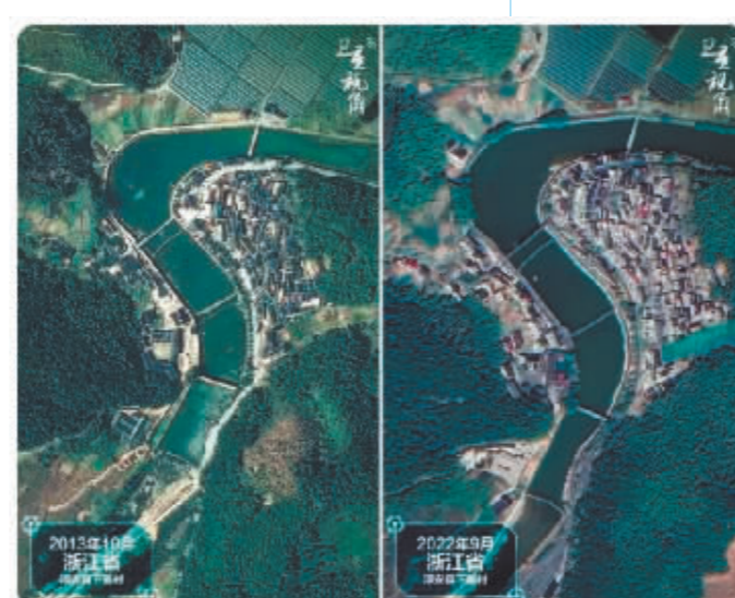
2022年跟2013年相比,在河流弯曲处不少平房变小楼,下姜村村容村貌改善。

浙江省淳安县下姜村从“穷山沟”变身“绿富美”,走在村里,但见远山含黛、溪水潺潺,石板路一尘不染,一栋栋小楼参差错落。目前,下姜村森林覆盖率超过90%,成功创建国家4A级旅游景区。 “希望蓝天常在、青山常在、绿水常在,让孩子们都生活在良好的生态环境之中……”习近平总书记不只一次这样深情讲述。 良好生态环境是最普惠的民生福祉。在习近平生态文明思想指引下,中国坚定不移走绿色发展之路,人与自然和谐共生的美丽中国,正在从蓝图变为现实。 (据新华社电)