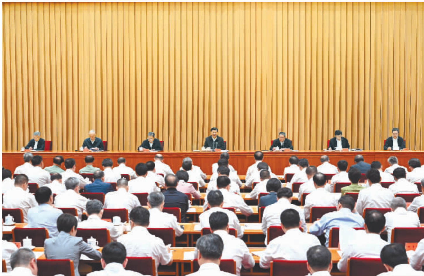
7月17日至18日,全国生态环境保护大会在北京召开。中共中央总书记、国家主席、中央军委主席习近平出席会议并发表重要讲话。李强、赵乐际、王沪宁、蔡奇、丁薛祥、李希出席会议。

新华社北京7月18日电 全国生态环境保护大会17日至18日在北京召开。中共中央总书记、国家主席、中央军委主席习近平出席会议并发表重要讲话,今后5年是美丽中国建设的重要时期,要深入贯彻新时代中国特色