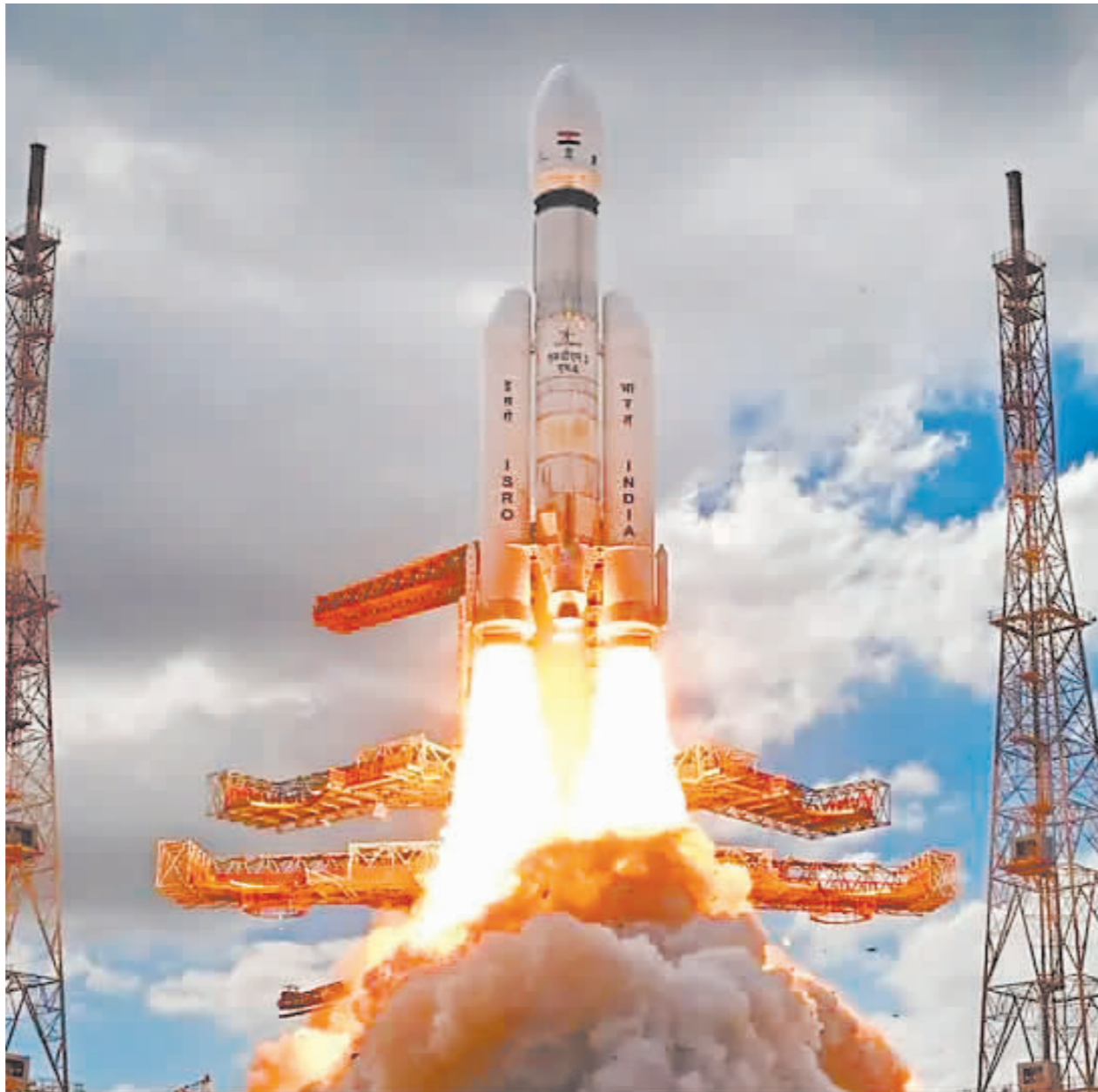
图为发射现场。人民网发

目前,全球只有美国、俄罗斯与中国的航天器成功登陆过月球。若印度月球探测器成功登月,印度将成为世界上第4个登陆月球的国家。