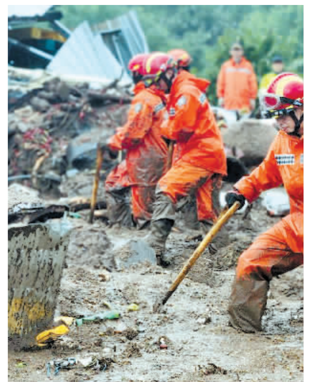
7月15日,消防人员在韩国醴泉的泥石流现场参与搜救。

据新华社电 韩国部分地区连日遭遇强降雨天气,据韩联社报道,截至15日下午强降雨已造成24人死亡,另有10人失踪。