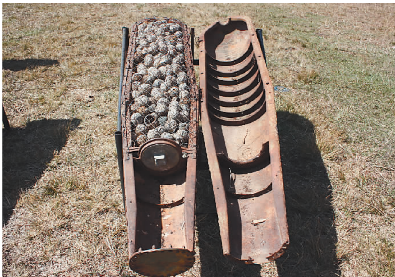
这是2009年7月1日在老挝川圻省拍摄的集束炸弹。1964年到1973年间,美国在老挝总计投下超过2.7亿枚集束弹药,其中约30%未爆炸,约8000万枚小炸弹散落、隐藏在老挝国土上。老方数据显示,自越战结束以来,老挝有5万多人因越战遗留未爆炸药爆炸事故中伤亡。