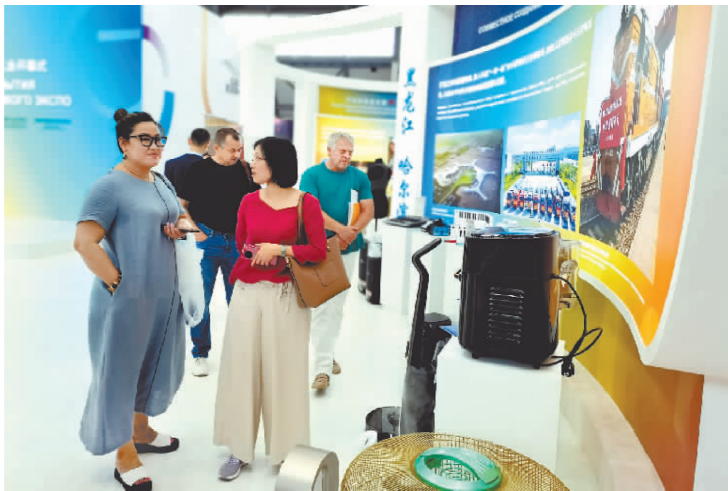
哈尔滨代表团主题展览释放多元合作吸引力。

第七届中国-俄罗斯博览会期间,哈尔滨市情和经贸合作推介会、中心展台哈尔滨推介、“多彩中国 佳节好物”推介等活动陆续举办,围绕我省构建向北开放新高地,以打造“七大都市”为抓手,强力推进经贸、产业等领域合作,不断创造互利共赢新商机。