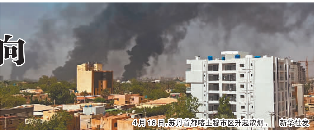
4月16日,苏丹首都喀土穆市区升起浓烟。

据新华社电 联合国秘书长安东尼奥·古特雷斯8日晚警告说,苏丹武装部队与快速支援部队之间军事冲突持续不断,“正把整个国家推向爆发全面内战的边缘,可能破坏整个地区的稳定”。