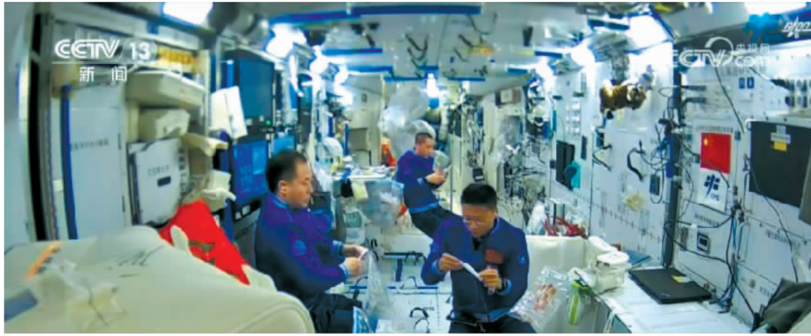
图为神舟十六号航天员乘组。

6月30日,中国载人航天工程办公室发布了2023中国载人航天年中“成绩单”。在这份“成绩单”中,一共记录了28项内容,从1月21日第二届“天宫画展”在中国空间站正式开展,神舟十五号乘组给全国青少年送来一份特别的“新年礼物”开始,一直记录到近日在天地协同配合下,空间站电推进系统大气瓶完成在轨安装任务,涉及神舟十四号、神舟十五号以及神舟十六号三个航天员乘组。其中,还包括了多项在空间站完成的科学实验和试验。可以说,这份沉甸甸的“成绩单”详细记录了中国载人航天这半年来的坚实步伐。