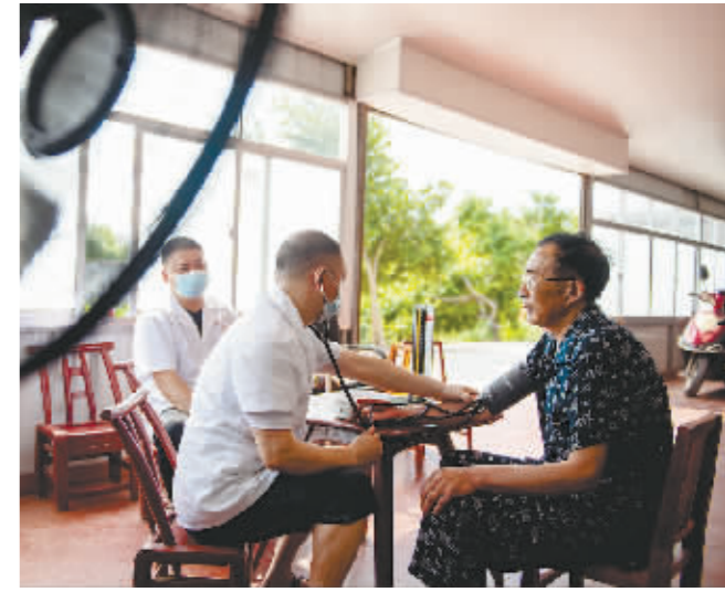
6月21日,在湖南常德市,医护人员上门为老年人做健康护理服务。

随着人民生活水平提高,以上门代厨、上门整理收纳、上门养老为代表的“上门经济”日趋走俏,不仅满足消费者多元化、个性化需求,还拓宽就业渠道,丰富了服务场景,让消费模式变得更为自由灵活。不过与此同时,“上门经济”也面临监管盲区、消费者维权难、取证溯源难等问题,需要加强规范引导。