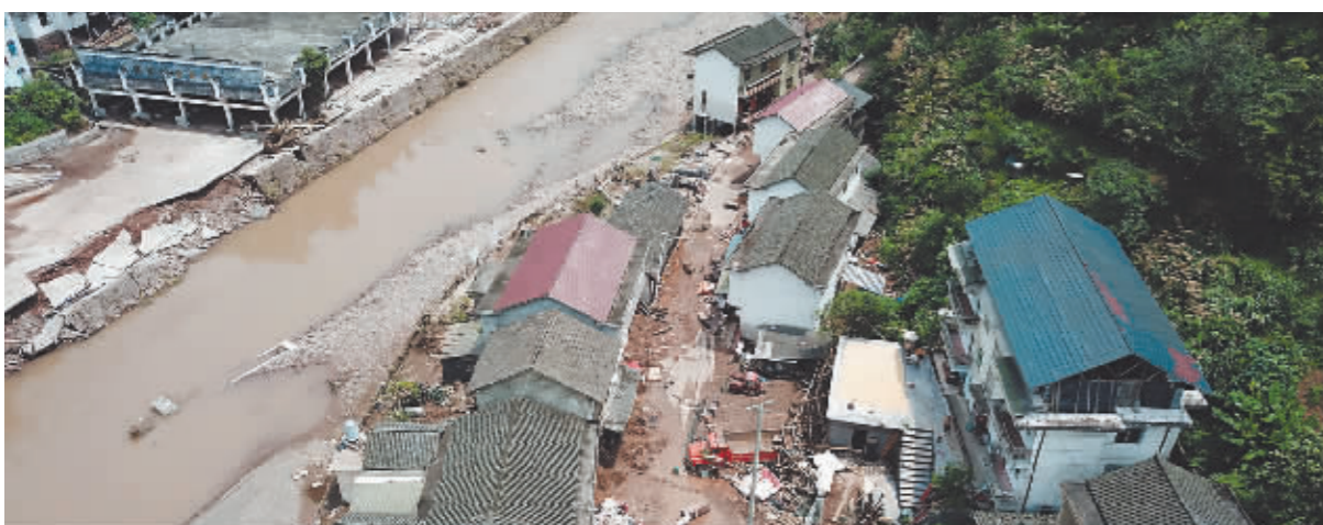
6月29日以来,湖南省湘西土家族苗族自治州遭遇今年入汛以来最强降雨过程,湘西州的古丈、保靖、永顺三个县不同程度受灾。目前洪水逐渐消退,受灾地区正组织干部群众抢险救灾,努力保障受灾群众基本生活需求。这是7月2日拍摄的湖南省湘西土家族苗族自治州古丈县岩头寨镇草潭村民居(无人机照片)。