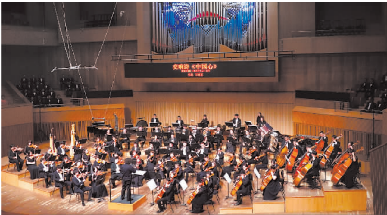
演出现场。

本报记者(记者 于秋莹)7月1日晚,由市委宣传部、市文化广电和旅游局主办,哈尔滨音乐厅(哈尔滨交响乐团)承办的“庆祝中国共产党成立102周年交响合唱音乐会”在哈尔滨音乐厅奏响,艺