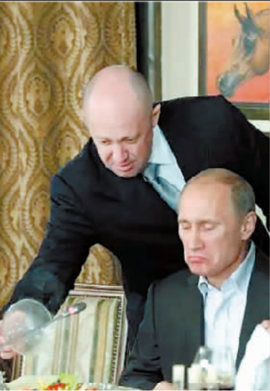
2011年11月11日,俄罗斯莫斯科郊外的一家餐厅,普里戈任(左)在为普京上菜。

目前,俄方已决定撤销此前对普里戈任的刑事立案,他也将前往白俄罗斯。等待他的将是什么,还是未知数。