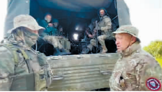
2023年6月,普里戈任(右)在前线与瓦格纳集团士兵交谈。