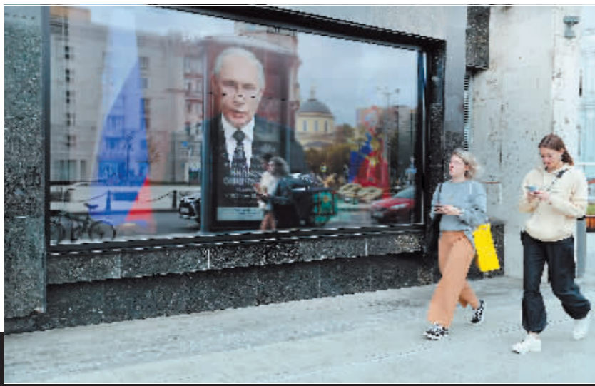
▲6月24日,在俄罗斯首都莫斯科,行人在播放俄总统普京电视讲话的屏幕前经过。