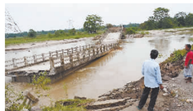
6月23日,人们在印度阿萨姆邦巴克萨地区查看一座受损的桥梁。近日,印度阿萨姆邦在降雨后遭到洪水侵袭。