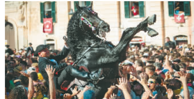
6月23日,在西班牙梅诺卡岛,一名“骑士”骑着骏马穿过参加圣胡安仲夏节庆祝活动的人群。6月24日是西班牙的传统节日圣胡安仲夏节,人们从23日开始举行各种庆祝活动,迎接夏天的到来。