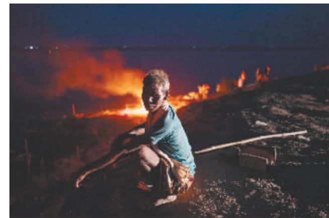
6月19日,在印度北方邦伯利亚,一名村民参加因高温引发病疫致死人命的葬礼。

据新华社电 印度媒体19日报道,该国人口最多的北方邦和比哈尔邦过去几天接近170人死于高温酷暑。不过,一些官员称,部分人死因与高温天气没有直接关系。印度气象局数据显示,印度北部地区近日最高气温达到43.5摄氏度,高于往年平均水平。印度政府在北方邦等地发布高温预警。据美联社报道,在印度,当气温突破45摄氏度或高于正常水平4.5摄氏度,政府才发布高温预警。美联社援引当地媒体与卫生官员的说法报道,最近几日这波高温天气在北方邦已致119人死亡,在比哈尔邦致47人死亡。