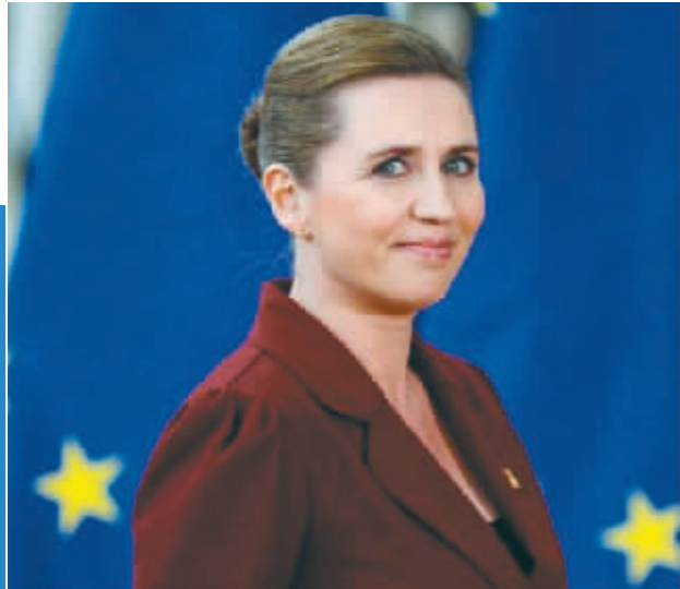
丹麦首相弗雷泽里克森。

北大西洋公约组织原打算下月在立陶宛首都维尔纽斯举行的成员国首脑会议上宣布新任秘书长,却迟迟未能就人选达成一致。媒体分析认为,北约成员国担心内部分歧遭暴露不利于军事支持乌克兰,现任秘书长延斯·斯托尔滕贝格可能还得再干一年。