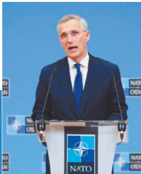
北约秘书长斯托尔滕贝格。