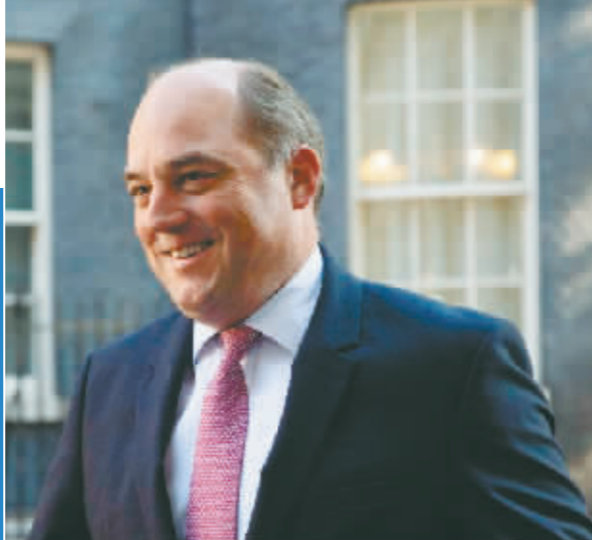
英国国防大臣本·华莱士。