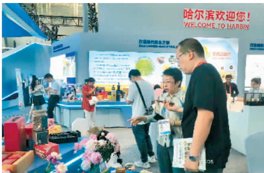
市农科院工作人员向客商介绍“哈农科”系列寒地农业科研产品。

在“哈农科”系列寒地农业科研产品展位,特色鲜明、品质超群的产品矩阵吸引了国内外客商,“哈农科”哈梗稻2号、哈梗稻10号等优质香稻品种,寒地桑葚院企合作桑叶茶、果桑酒等系列产品,珊瑚猴头菇“SHS-1”、食药同源槐耳“AS-7”、白耙齿菌“BPC-1”等科研产品参展,引起高度关注,引来多方合作洽谈。