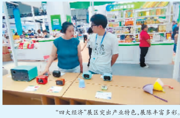
“四大经济”展区突出产业特色,展陈丰富多彩。

引领未来”为参展主题,展厅中间重点展示了思灵智能手术机器人、哈医大3D骨科打印器材、善行医疗心电衣、星湖科技生物发酵产品、北科生物和博能环保沙盘等。