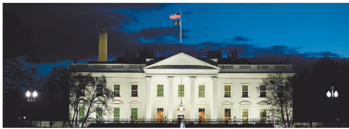
这是1月20日在美国首都华盛顿拍摄的白宫。

1960年底开始,美国中央情报局和其他机构通过反古媒体散播谣言,称古巴革命政府将剥夺本国儿童的父母监护权并将儿童送去他国进行政治“洗脑”。