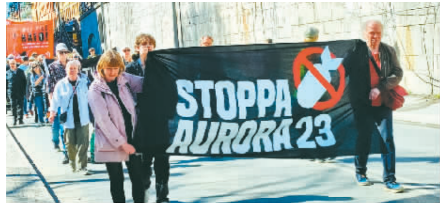
4月22日,人们在瑞典斯德哥尔摩参加抗议活动。

俄罗斯科学院世界经济与国际关系研究所高级研究员亚历山大·卡姆金告诉俄罗斯卫星通讯社,北约此次军演规模比以往大很多,目的是向俄