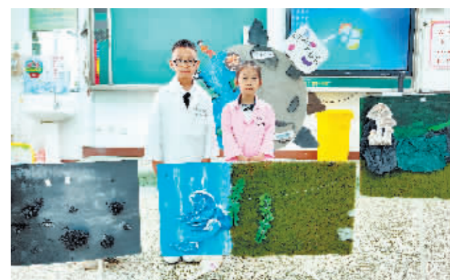
同学们展示自己创作的绘画作品。

本报讯(记者 叶勇)6月10日是文化和自然遗产日,省博物馆、省民族博物馆举办2023年环球自然日黑龙江赛区决赛等多项公益文化活动。