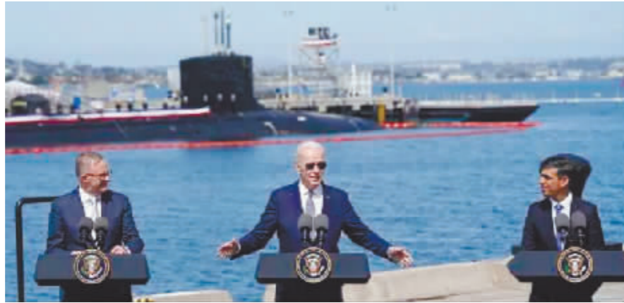
美英澳宣布核潜艇合作计划。

美英澳核潜艇合作计划自公布伊始,便遭到国际社会诸多质疑,但三国一意孤行推动该计划。