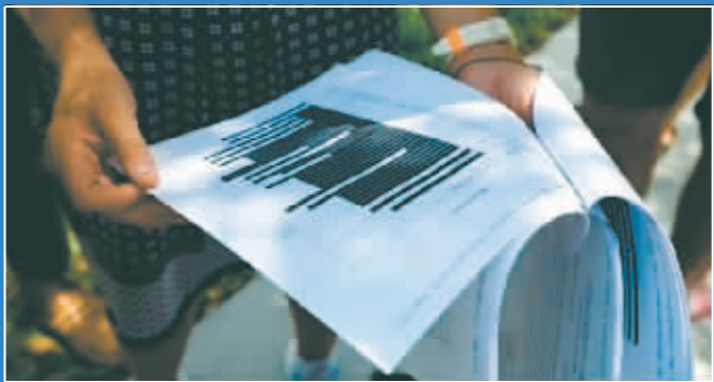
当地时间2022年8月26日,美国司法部公布FBI申请搜查海湖庄园时的书面证词,文件多页涂黑。