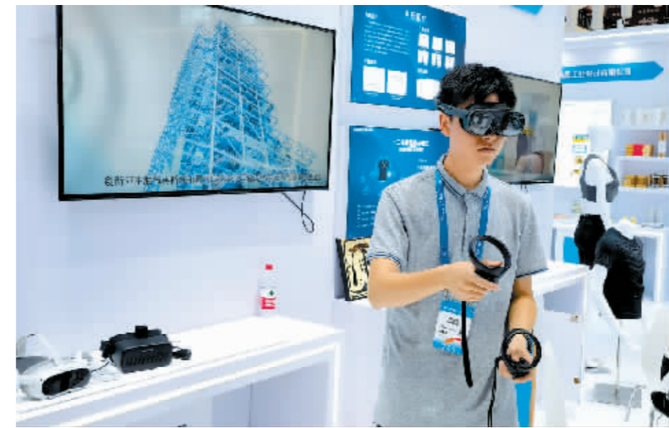
VR 体验高山速降滑雪。

本报深圳电(特派记者 张莹雷 文/摄)在去年的雪博会和创博会上,来自哈尔滨的企业爱威尔科技有限公司凭借逼真的滑雪体验和“一秒入境”的真实感火爆全网。而在第十九届中国(深圳)国际文化产业博览交易会哈尔滨展馆内,爱威尔带着VR产品又火了一把。