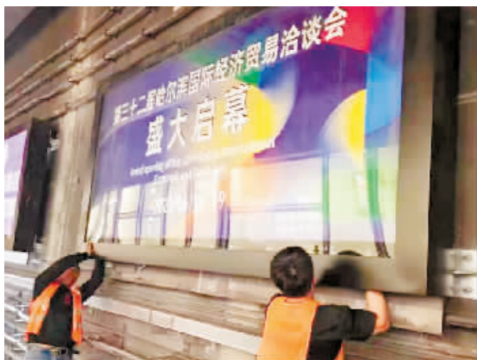
地铁隧道内加装“哈洽”宣传板。

红旗家具城在 2006 年首次成为第十八届哈洽会分会场，2008 年被哈洽会组委会正式批准为家居商品专业展馆，2014 年升级为中俄博览会家具馆。本届哈洽会，红旗家具城作为分会场，将通过各种推介、优惠活动，展现龙江家具行业的魅力。