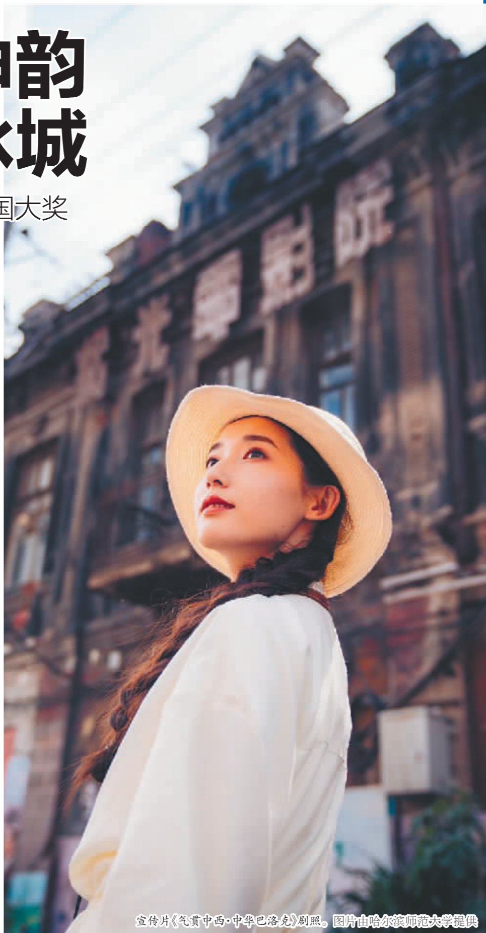
宣传片《气贯中西·中华巴洛克》剧照。

未来,从顶层策划到艺术产品生成再到营销推广,哈尔滨师范大学通过打造创意设计价值链、创新链,充分发掘各学科专业特长和不同文化艺术领域的独特资源,精准对接有需求、有发展空间的地方品牌和企业,通过地校合作纽带,提升哈尔滨市各大产业的创意附加值和产品附加值,赋能经济社会发展。