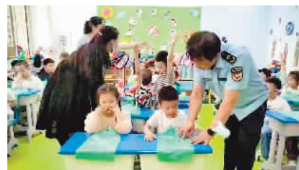
孩子们进行垃圾分类游戏。

本报讯(记者 霍亮)为推进垃圾分类工作的有效实施,增强社区居民对垃圾分类知识的学习,哈市各社区垃圾分类宣教活动在夏日里火热开展。社区工作人员通过发放宣传单、现场答疑、互动游戏等方式,让市民尤其是孩子们积极参与垃圾分类,树立环保理念。