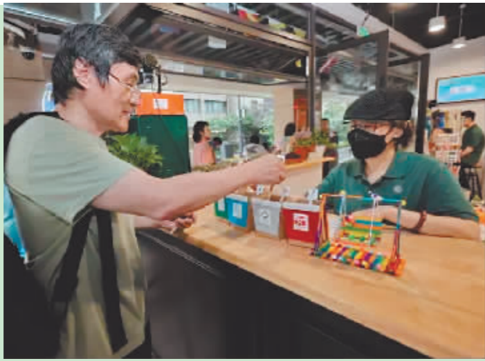
6月5日，市民在上海航海邮局快闪市集上体验“垃圾分类”活动。

“我们团队正在做的生物基材料，是利用秸秆、竹子等天然高分子材料研发出的新材料，具备良好的生物可降解性。”贵州大学材料与冶金学院教授谢海波说，团队从农民那里收集秸秆、竹子等原材料，加工成电脑键盘、面板等。