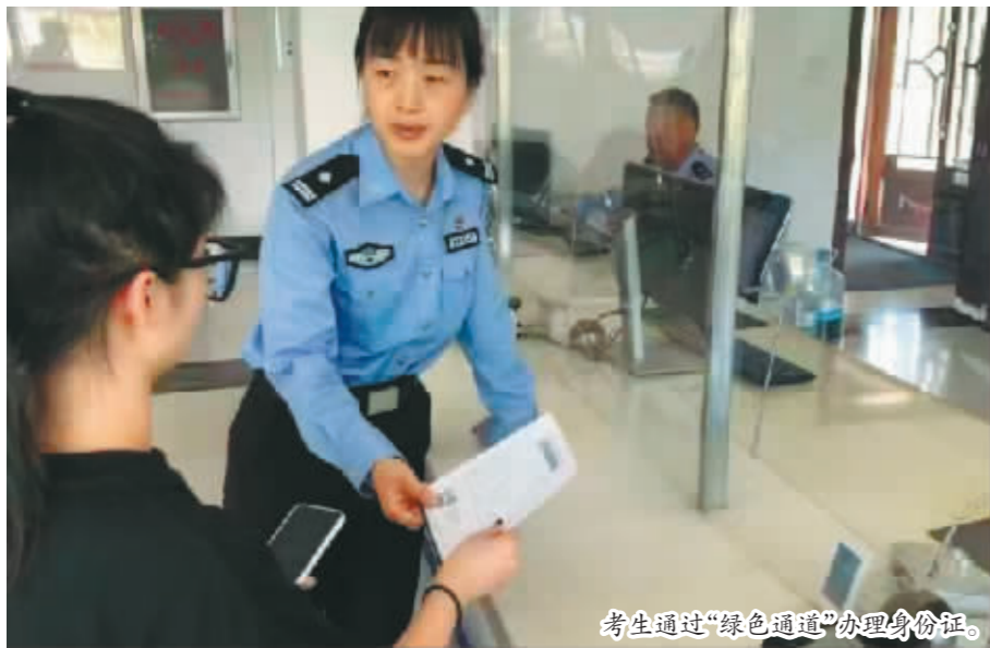
考生通过“绿色通道”办理身份证。

本报(记者 王晓)“太感谢警察叔叔了,马上就高考了,身份证怎么找也找不到了,心里急得不行!我妈也怕影响了我的考试状态。又赶上星期天,没想到公安局户政大厅开通的‘助考绿色通道’周六、周日专门对考生开放,不但为我们安排了临时休息室,而且几分钟就帮我们办好了临时身份证,爸爸妈妈也都放心了,太感谢人民警察了……”在哈尔滨市阿城公安分局户政大厅,高考考生小王拿着新办的身份证连连感谢。