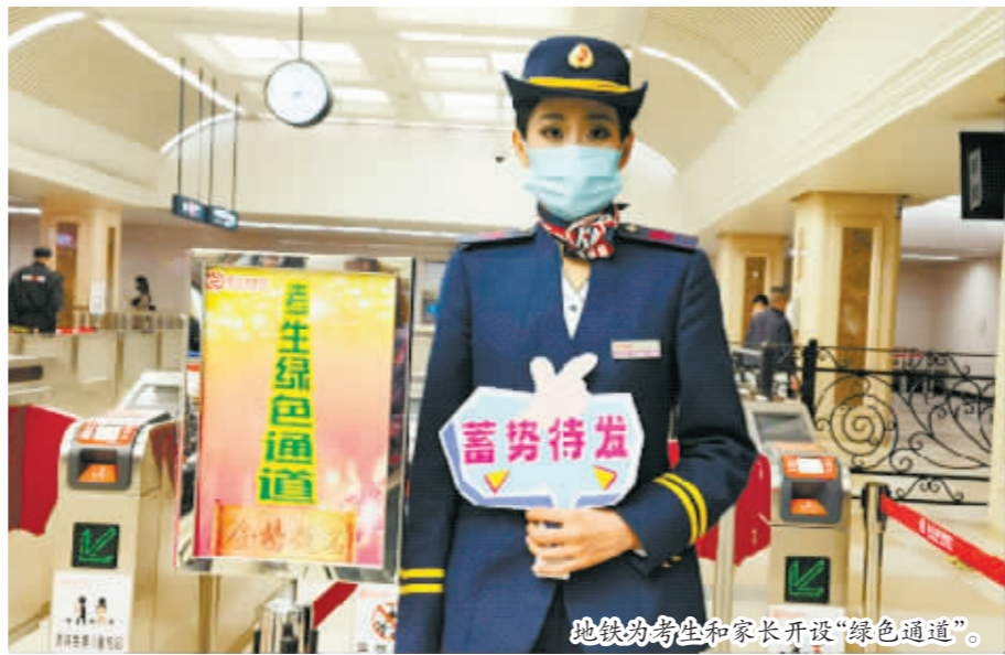
地铁为考生和家长开设“绿色通道”。

本报(耿占东 刘金铃 记者 温婧)又是一年鲜花季,又是一年高考时。哈尔滨地铁集团为助力高考,推出了“免费乘车+绿色通道”等一系列暖心举措,为考生及家长顺利出行提供温馨、周到的服务。