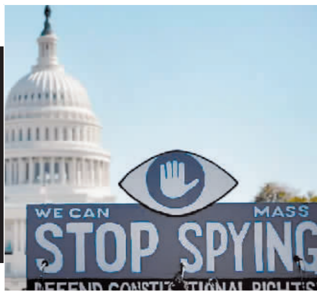
一块反监控的大型标语牌立在美国国会大厦前。

十年过去了，遭到美国政府通缉的斯诺登如今居住在俄罗斯，已获得俄罗斯国籍。“棱镜门”事件引发全球对美国大规模监听活动的强烈谴责，但美国并未悔改，十年来仍不断曝出各种监听他国的丑闻，其中不少受害国家还是美国的盟友。这些事件反复证明，美国为维护自身霸权不择手段，是不折不扣的“监听帝国”。