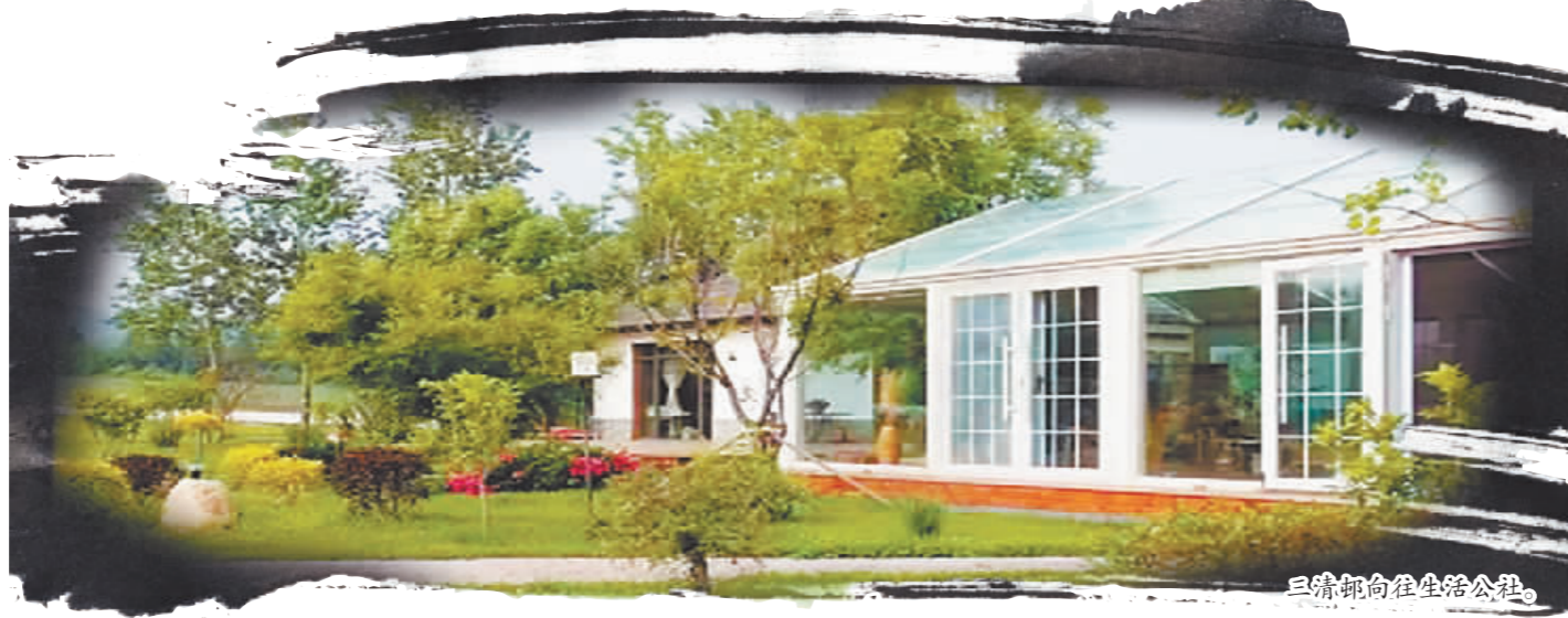
三清屯向在生生活公程。

光,阿城区借助当地的绿水青山,强化创新设计赋能乡村振兴,通过不同IP主题构建文旅综合体,打造“企业+村民”的联动发展模式,实现村庄效能的整体腾飞升级。