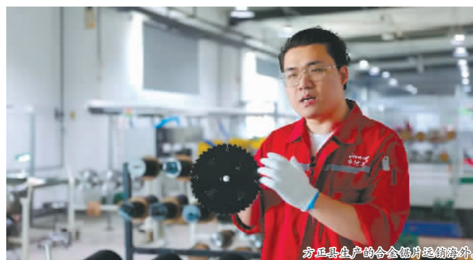
方正县生产的合会铝片远销海外。

完善五项配套机制。组建“7+1+N”专班,统筹运用“四个体系”推进工作落实。强化县级领导包联制度,24名县级领导深入包联企业60余次,帮助协调解决问题16个。完善产业振兴政策体系,抓好政策宣传和对上推报争取,全县17个项目获得前两批专项债券审核反馈,预计年度发行债券资金4.64亿元。