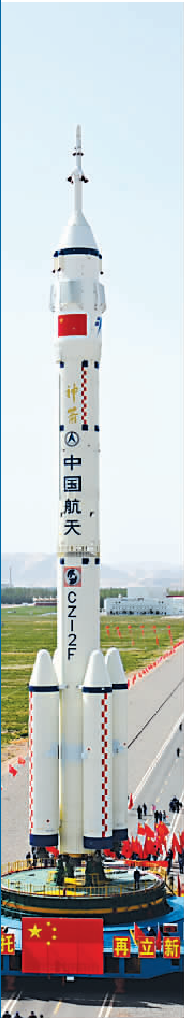
神舟十六号载人飞船与长征二号F遥十六运载火箭组合体在转运途中。

“计划今年年底前完成全部选拔工作。”林西强说,如果港澳地区的候选对象通过复选和定选,可于明年初进入航天员科研训练中心。