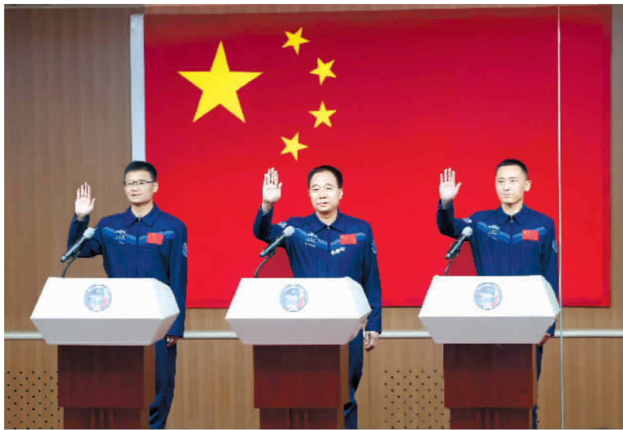
这是指令长景海鹏(中)、航天飞行工程师朱杨柱(右)、载荷专家桂海潮挥手致意。

林西强说,经空间站应用与发展阶段飞行任务总指挥部研究决定,瞄准北京时间5月30日9时31分发射神舟十六号载人飞船,飞行乘组由航天员景海鹏、朱杨柱和桂海潮组成,景海鹏担任指令长。航天员景海鹏先后参加过神舟七号、九号、十一号载人飞行任务,朱杨柱和桂海潮都是首次飞行。