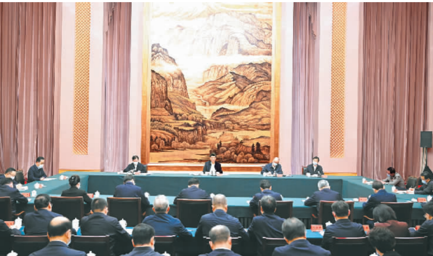
5月17日上午,中共中央总书记、国家主席、中央军委主席习近平在陕西西安主持中国—中亚峰会前夕,专门听取陕西省委和省政府工作汇报,发表了重要讲话。