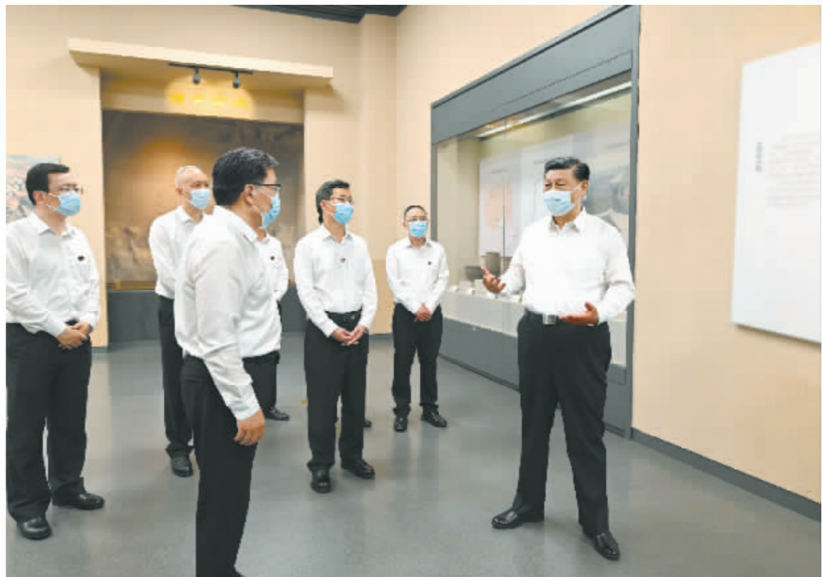
5月16日下午,中共中央总书记、国家主席、中央军委主席习近平在前往陕西西安主持中国—中亚峰会途中,在山西运城博物馆考察。

新华社陕西西安/山西运城5月17日电 中共中央总书记、国家主席、中央军委主席习近平在听取陕西省委和省政府工作汇报时强调,陕西在推进中国式现代化建设中要有勇立潮头、争当时代弄潮儿的志向和魄力,奋力追赶、敢于超越,在西部地区发挥示范作用。要完整、准确、全面贯彻新发展理念,紧紧围绕高质量发展这个首