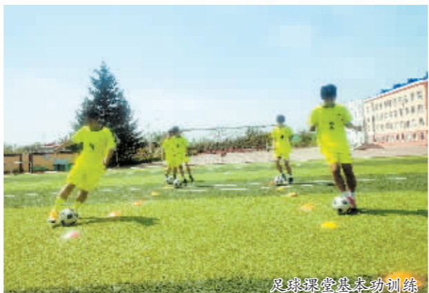
足球课堂晨练动作训练