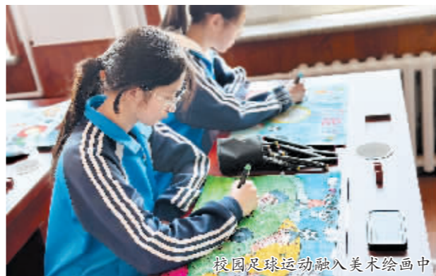
校园足球运动融入美术绘画中

足球走进评价。在足球课堂教学中,对青一中非常注重学生的发展性评价,在关注学生对足球基本知识、技能掌握程度的同时,更加注重学生个人坚韧的意志品质、合作的意识、团队精神的形式。因此,学校每学期会根据教学目标任务,对学生进行足球项目测试,并将测试结果作为学生的体育成绩之一,记入学生综合素质报告中。