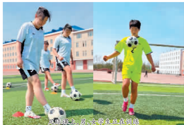
足球课上,男、女学生正在训练