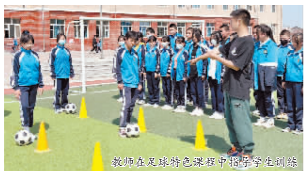
教师在足球特色课程中指导学生训练

为两大校例化活动。在每年5月举行体育健康节,对青一中以田径运动会为主体,辅之进行校内足球年级联赛,以及足球接力、足球拓展游戏等小型竞赛;在每年12月举行的冰雪欢乐节中,学校更是积极开展雪地足球年级联赛、冰趣运动会等竞赛。每到两大节期间,学校校园的氛围就像被点燃的礼花一样,绚烂多彩、夺人目光,加油呐喊声不绝于耳,欢声笑语遍布校园每一个角落。