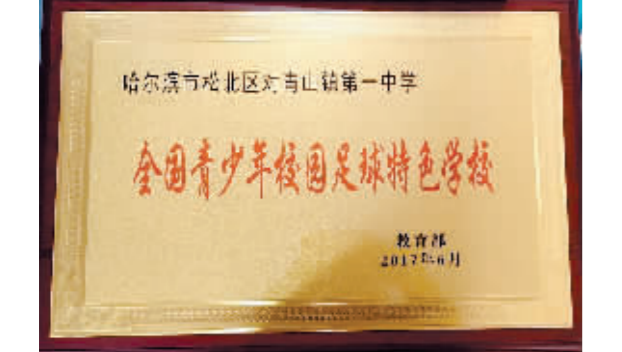
全国校园足球特色学校

在2022年被哈尔滨新区管委会认定为“新品牌培育学校”后,展望未来三年,在新区教育改革大旗引领下,哈尔滨市松北区对青山镇第一中学校将以校园足球特色作为学校品牌底色、亮色,通过卓有成效的三年行动,以学生综合素质全面提升为目标,以科学管理为方略,系统化推进学校内涵发展,并使“新品牌培育学校”字号成为学校教育教学水平和特色项目双轮驱动、高质量发展的加油站,推动学校新品牌建设实现新跨越,为新区教育事业的大踏步前进和弯道超车式地追赶而努力奋斗!