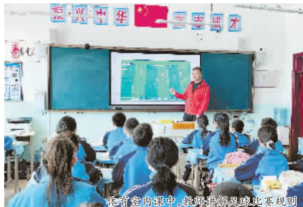
体育馆内课中,教师讲解足球比赛规则