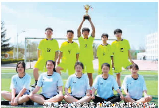
校男、女足球队获得区级足球冠军荣誉合影