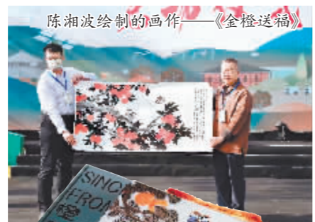
通过《金橙送福》打造的“艺术橙”产品。

此次,深圳报业电子商务有限公司借创博会这一契机,将加大深度合作,用创意设计赋能黑龙江大米、玉米、杂粮等特色产品,提升品牌辨识度,将黑土优品推向大湾区,让黑龙江产品卖得更好。