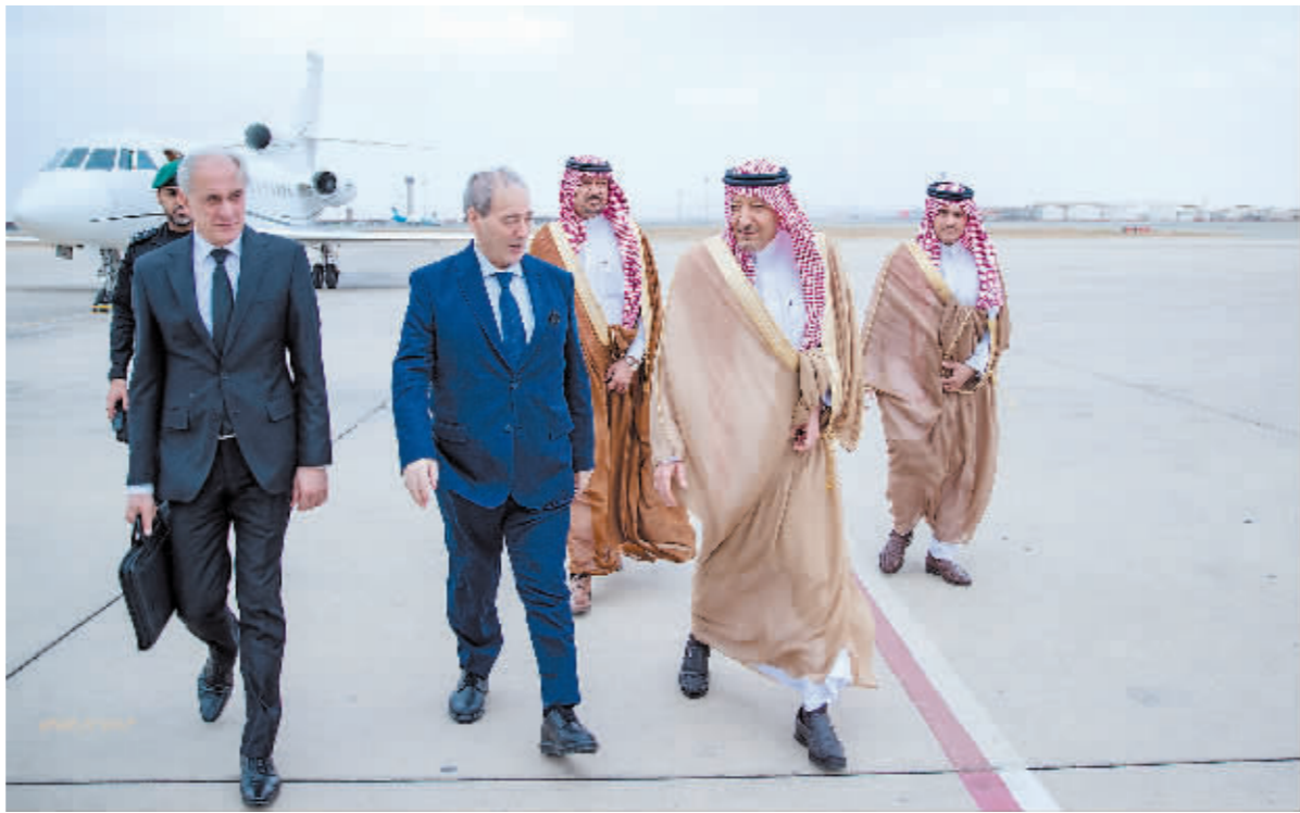
4月12日,叙利亚外长梅克达德访问沙特,图为梅克达德(前中)抵达沙特阿拉伯西部港口城市吉达。

分析人士认为,阿拉伯国家和叙利亚改善关系有各自利益考量。叙利亚政治学专家胡萨姆·舒艾卜说,叙政府迫切需要改善经济、推进国家重建,面对西方国家制裁,加强地区经济合作成为选项之一。同时,与阿拉伯国家加强互动可以进一步获取政治支持,摆脱持续多年的外交困境。