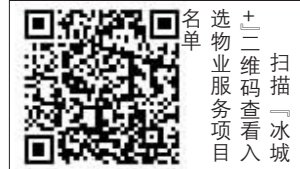
扫描二维码 查看物业服务项目

13%;异地业务量累计完成41620.7万件,同比增长23%;国际/港澳台业务量累计完成512.4万件,同比增长66.9%。 今年,哈市邮政快递行业将加大“交邮供”融合发展力度,巩固“快递进村”成果,加快推进“快递进厂”“快递出海”工程等,更好地满足农民生产生活需要,释放农村消费潜力,便利农产品出村进城,助力乡村振兴。