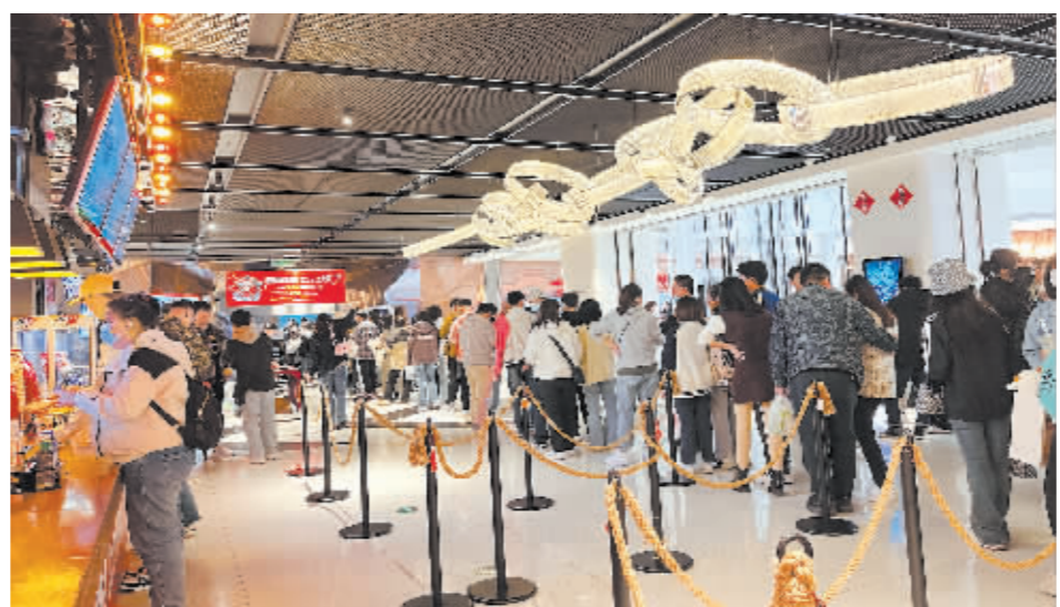
右图:观众排队入场。

晨2时才散场。 4月30日,哈尔滨各大影城售出电影票68528张,总票房达308.81万元,由哈尔滨演员乔杉主演的喜剧电影《人生路不熟》占据一半以上的票房。其中,万达影城哈西店杀进全国影院票房榜前六,全天票房20.9万元。万象影城和CGV影城红博中央公园店排在哈尔滨影院票房榜第二名和第三名。 由于票房黑马《人生路不熟》在哈尔滨超过全国预售冠军《长空之王》,以27%的排片拿下了53.5%的票房,所以5月1日哈尔滨影院增加了《人生路不熟》的场次,排片高达31.3%,观众完全不用担心买不到票。