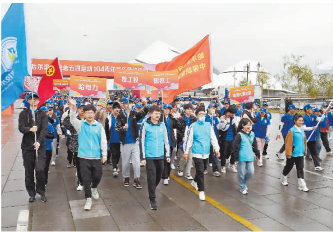
哈市青年代表参加徒步活动。

本报讯(记者 阴祖峰)为深入学习宣传贯彻党的二十大精神,纪念五四运动104周年,高质量推进青年发展型城市建设试点工作,5月4日上午,团市委组织开展“学习二十大、永远跟党走、奋进新征程”哈尔滨市纪念五四运动104周年青年徒步活动。市委常委、副市长栾志成出席启动仪式。 伴随着发令汽笛鸣响,来自全市企事业单位、高校、青联以及各区各行业的青年代表3000余人从哈尔滨大剧院广场出发,途经风光旖旎的滨水大道,穿过见证冰城百年历史的松花江铁路大桥,走进充满欧陆风情的斯大林公园,最终抵达人民广场。活动历时近两个小时,全长约6公里。全程共设置7个打卡点,纪念印章以打造“七大都市”为内容,旨在宣传哈尔滨市发展战略,引导青年紧跟全市中心大局奋进新时代、勇当生力军。 去年6月,哈尔滨被确定为全国青年发展型城市建设试点,市青年联席会议成员单位紧紧围绕打造“七大都市”奋斗目标共同发力、集中攻坚,形成了青年主动融入城市、与城市共同成长的良好环境。此次徒步活动,集中展示了新时代哈尔滨青年的良好精神风貌,引导激励广大青年朋友为加快打造“七大都市”、奋力开创哈尔滨现代化建设新局面贡献青春、智慧和力量。