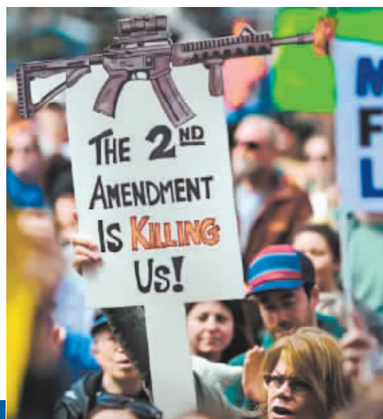
美国民众举行反枪支暴力游行。

美国得克萨斯州警方4月29日说,一名男子半夜在自家院子开枪自娱,遭邻居劝阻。这名男子竟然闯入邻居家大开杀戒,杀害5人,其中包括一名年仅8岁儿童。