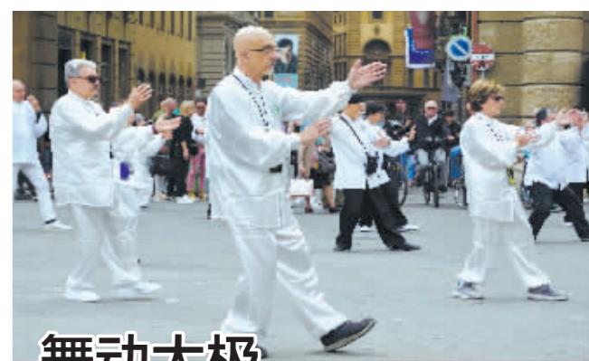
4月29日,在意大利佛罗伦萨,当地太极爱好者打太极拳。

每年4月的最后一个星期六是“世界太极日”。世界各地的太极爱好者在当日举办活动,表演太极,切磋技艺。