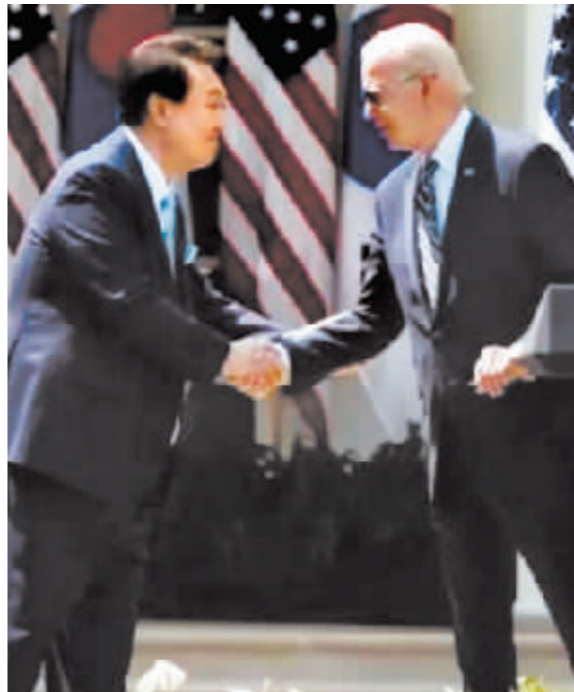
尹锡悦(左)与拜登握手。

尹锡悦访美期间与美国总统拜登举行会谈。双方同意升级对韩国提供“延伸威慑”,并发表《华盛顿宣言》称,将扩大美韩核危机磋商、新增美韩军事训练和模拟演习、成立“美韩核磋商小组”机制、扩大半岛周边美战略资产出动等。