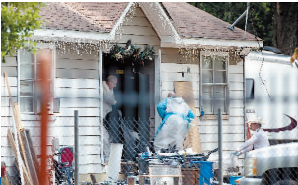
4月29日,在美国得州圣哈辛托县,执法人员在发生枪击事件的住宅搬运遇难者遗体。