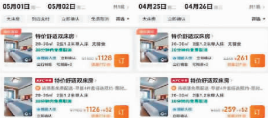
西双版纳某酒店5月1日入住价格比4月25日入住价格高了近千元。

面对狂飙的酒店价格,有网友表示:“五一”客房涨价,哪里都不去,宅在家隔着屏幕闻花香。”