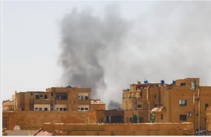
4月22日,苏丹喀土穆上空升起浓烟。

世卫组织表示,位于喀土穆的苏丹国家公共卫生实验室被冲突一方控制,该实验室存放有脊髓灰质炎、麻疹、霍乱等疾病的分离物或样本,情况极其危险。