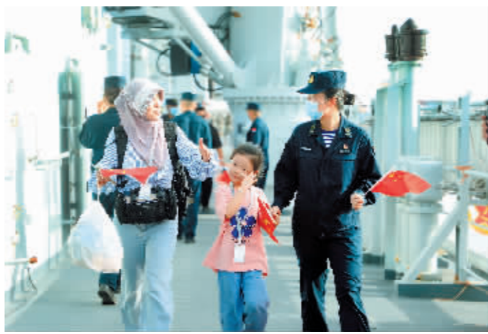
▲撤离人员登上微山湖舰。▲海军陆战队队员在撤离现场担负警戒任务。

新华社北京4月27日电 经习主席和中央军委批准,当地时间4月26日,中国海军导弹驱逐舰南宁舰、综合补给舰微山湖舰紧急驶赴苏丹,执行撤离我在苏丹人员任务。当地时间27日10时许(北京时间27日15时许),首批撤离的678人已随海军军舰安全抵达沙特阿