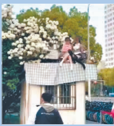
小房顶上成打卡地。