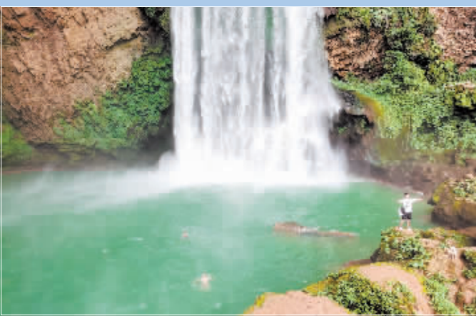
两名游客在贵州省清镇市羊皮洞瀑布下方的水潭里游泳。