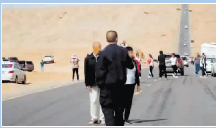
游客扎堆聚集于网红公路。