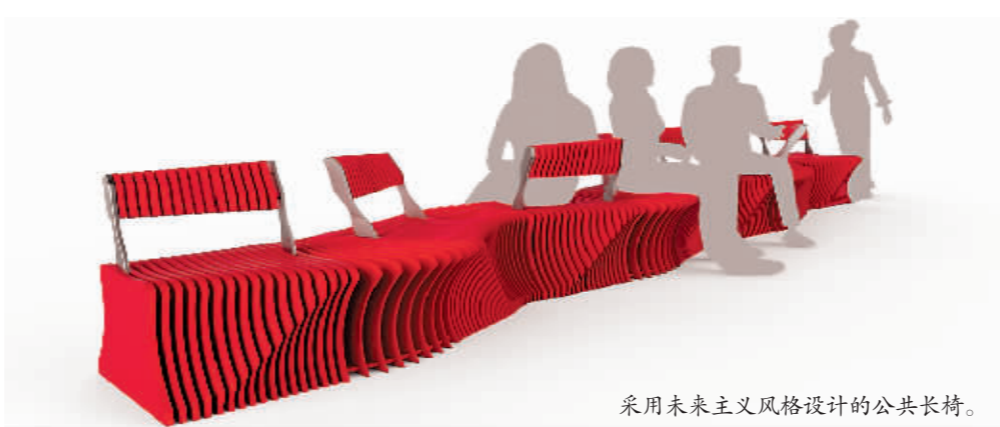
采用未来主义风格设计的公共长椅。