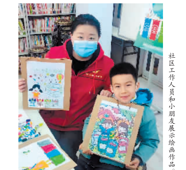
社区工作人员和小朋友展示绘画作品。

本报讯(记者 霍亮)五颜六色的蜡笔摆满书桌,男女老少一齐创作,四色垃圾分类桶的图案跃然纸上。近日,道里区兆麟街道办事处索菲亚社区组织了一场以“创生活,文明分类”为主题的垃圾分类主题绘画活动。当日,辖区多位居民来到索菲亚社区活动中心用画笔描绘了他们对垃圾分类绿色新生活的畅想。