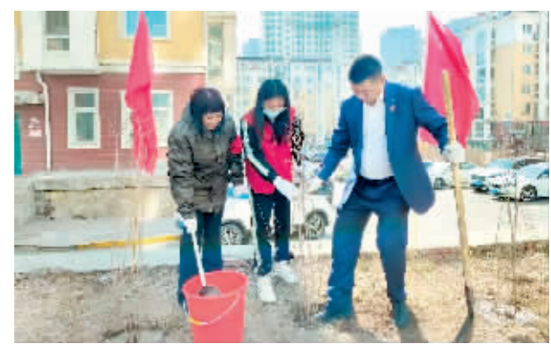
业主和物业人员共同种下爱心树苗。

本报讯(记者 刘述波)最是一年春光好,植树添绿正当时。为进一步提升小区环境质量,近日,哈市多家物企联合社区组织员工和小区业主,通过开展“认领一棵树、守护一片绿”等活动,共同为小区植树添绿。