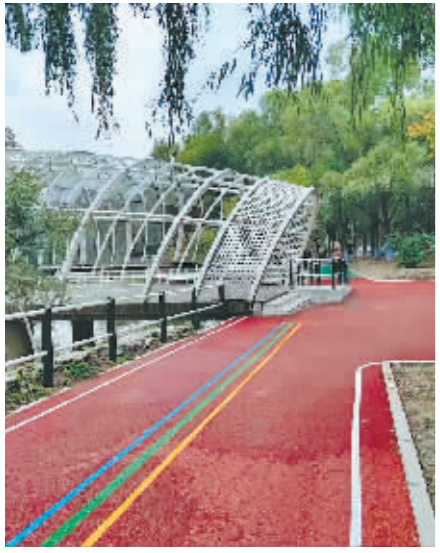
上图:建设完工的马家沟绿道。 右图:市民漫步在公园绿道。