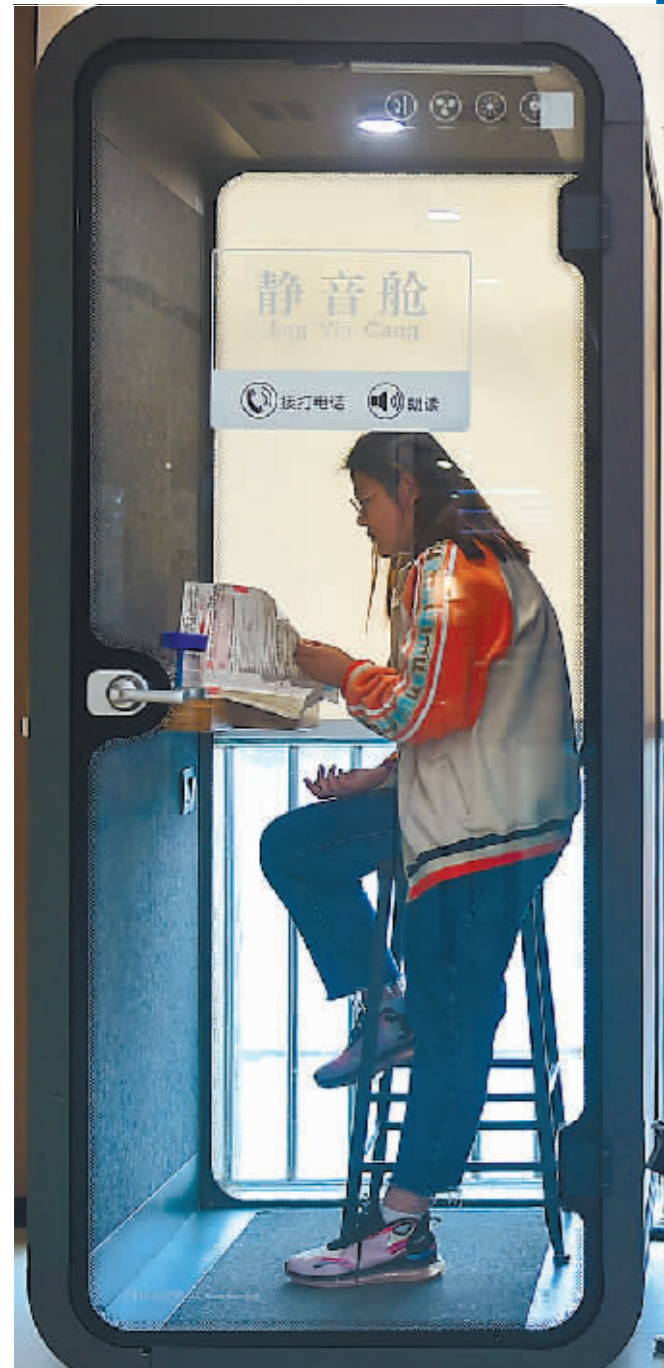
4月22日,读者在河南省洛阳市图书馆“静音舱”内读书学习,享受安静的阅读空间。

你有读书的习惯吗?过去一年,你读了几本书?23日在杭州开幕的第二届全民阅读大会上,发布第20次全国国民阅读调查结果。调查发现,2022年我国成年国民包括书报刊和数字出版物在内的各种媒介的综合阅读率为81.8%,保持增长态势。