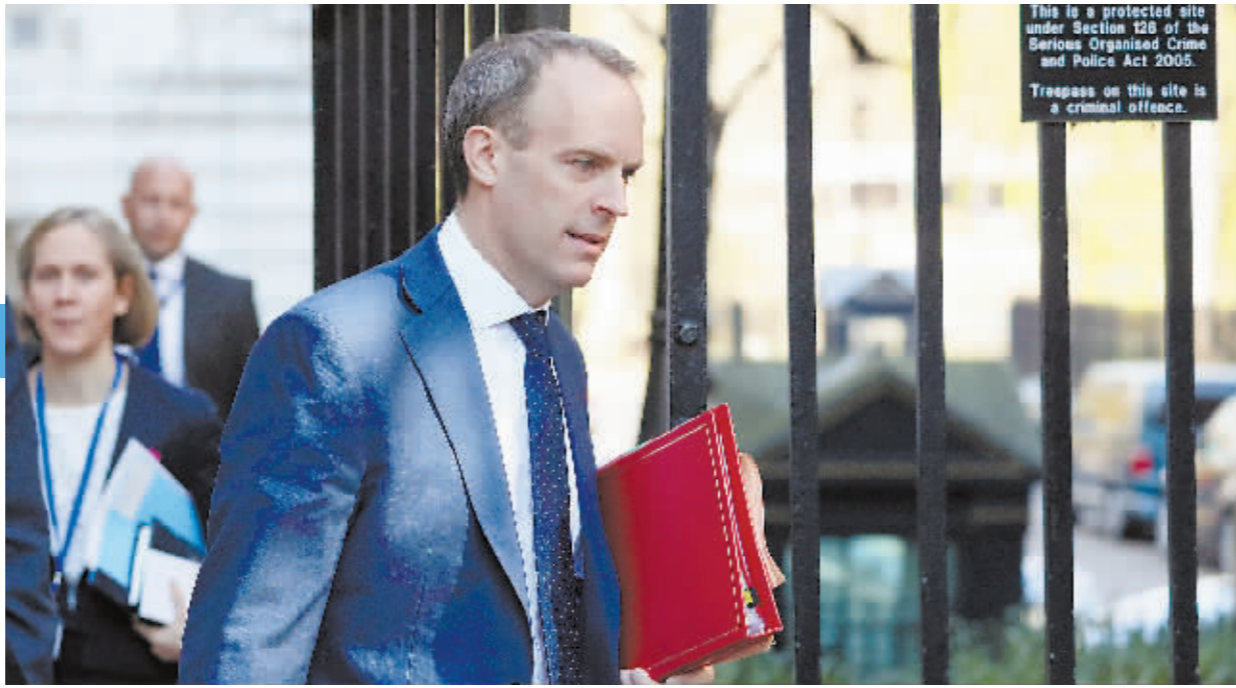
多米尼克·拉布资料片。