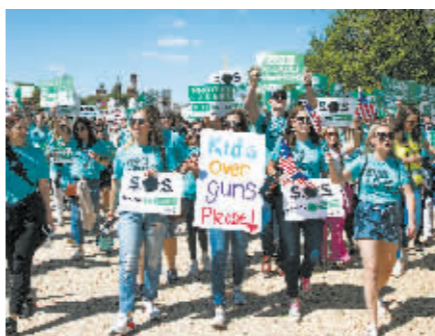
4月17日,人们在美国首都华盛顿参加控枪游行。