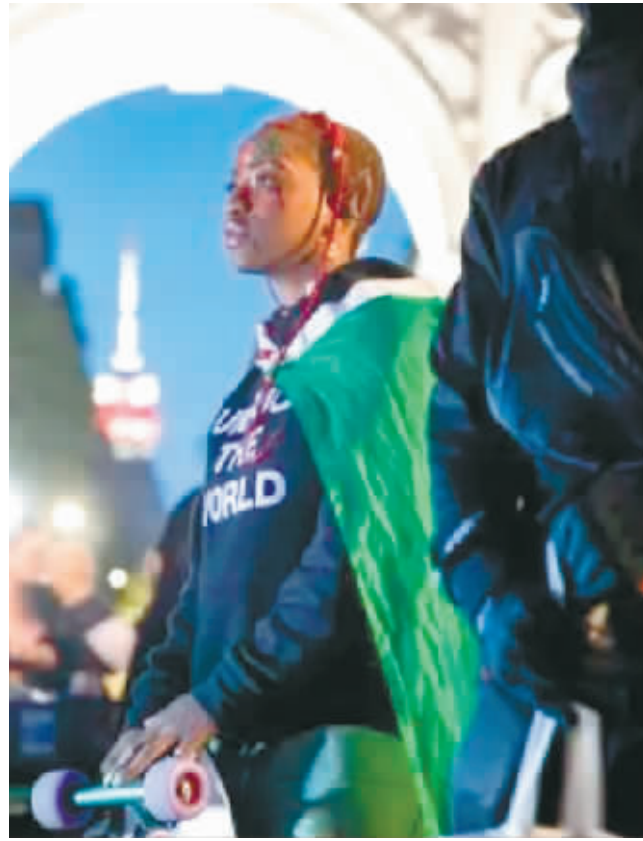
2021年5月31日,在美国纽约,一名参加纪念塔利萨族屠杀一百周年活动的女子额头贴有“塔利萨”字样的装饰。