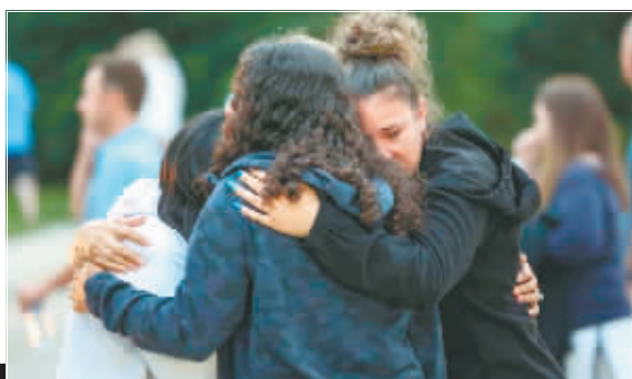
人们悼念枪击案遇难者时相互拥抱。