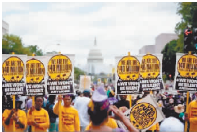
2022年6月18日,来自美国全国各地的数千民众在华盛顿国会大厦附近举行集会,抗议美国根深蒂固的种族歧视以及由此引发的经济不公等一系列社会问题。