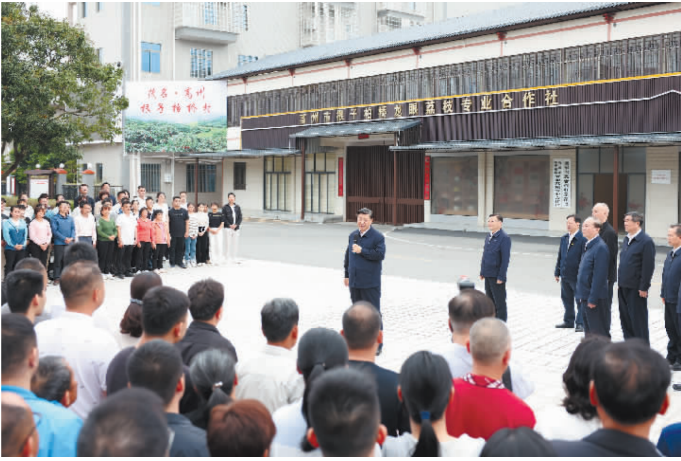
11日下午,习近平在茂名高州市根子镇柏桥村同村民亲切交流。

新华社广州4月13日电 中共中央总书记、国家主席、中央军委主席习近平近日在广东考察时强调,广东是改革开放的排头兵、先行地、实验区,在中国式现代化建设的大局中地位重要、作用突出。要锚定强国建设、民族复兴目标,围绕高质量发展这个首要任务和构建新发展格局这个战略任务,在全面深化改革、扩大高水平对外开放、提升科技自立自强能力、建设现代化产业体系、促进城乡区域协调发展等方面继续走在全国前列,在推进中国式现代化建设中走在前列。 4月10日至13日,习近平在中共中央政治局委员、广东省