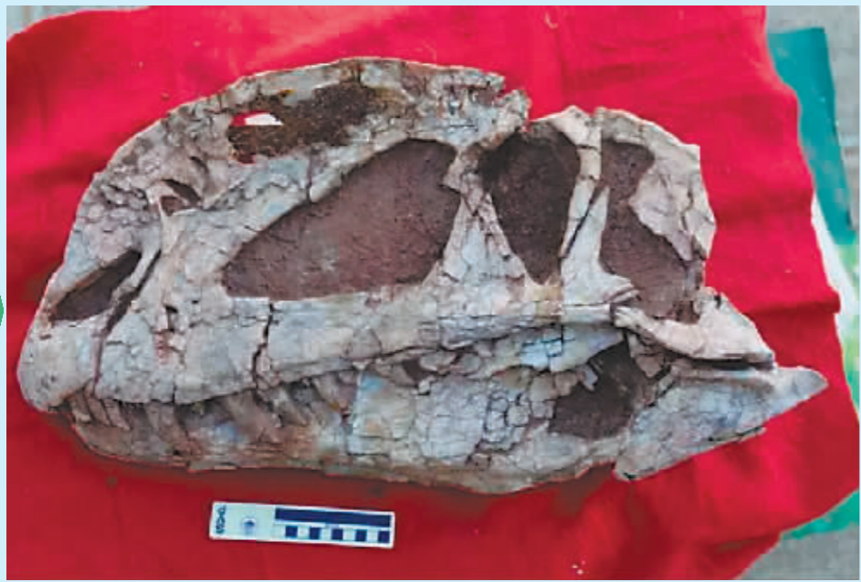
三叠中国龙完整头骨化石。