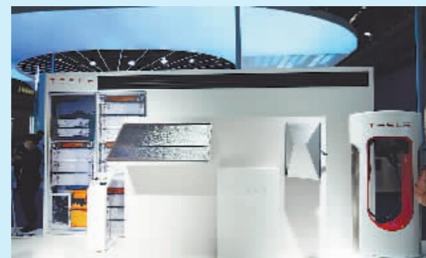
在特斯拉的全方位能源供应展区,所展出产品包括太阳能屋顶、家用储能电池及充电桩。