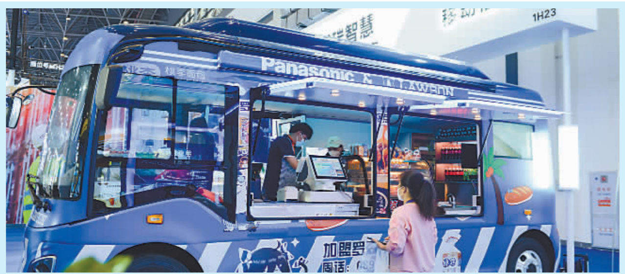
消博会上展出的纯电动移动便利店。

近年来,我国持续释放大力发展绿色消费信号。海南国际经济发展局副局长官起君说,依托消博会这一绿色消费的创新试验地,相信更多海内外企业会加快转型,形成行业合力,推动实现更加强劲、绿色的全球发展。