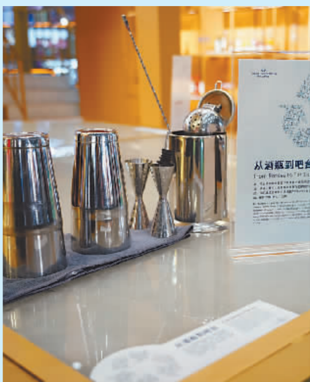
保乐力加中国展台展示的由废弃空酒瓶制作的循环再生吧台。