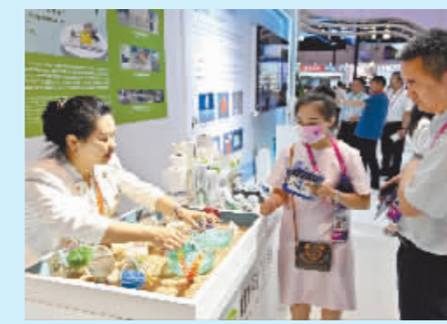
海南展台的工作人员介绍快速降解材料和降解过程。