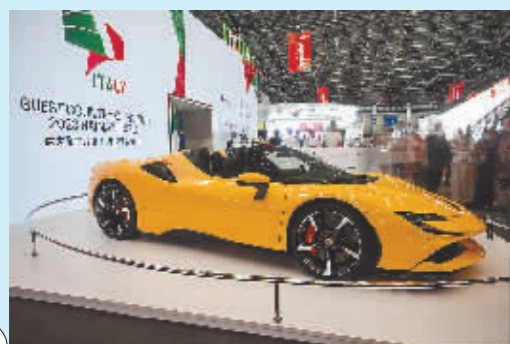
在消博会上拍摄的来自意大利的跑车。