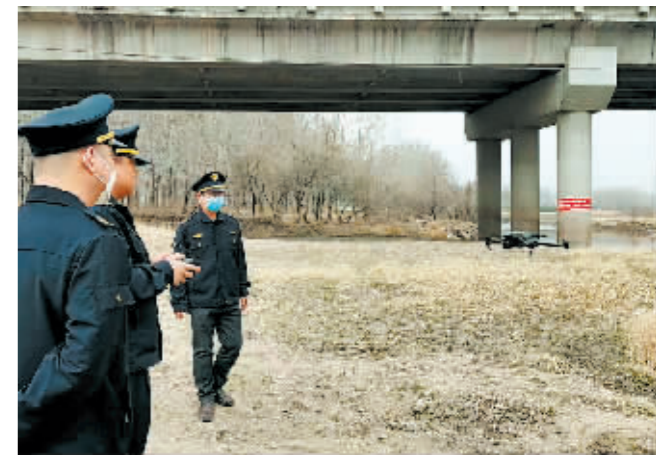
执法队员操控无人机。

本报讯(郑智佳 记者 霍亮)由于受到地域空间等物理原因限制,打击电鱼等非法捕捞行为一直面临巡查难、取证难。日前,香坊区综合执法局执法人员采用无人机鹰眼技术,对辖区阿什河流域非法捕捞行为进行点面结合的全覆盖巡查,大幅提升了执法效能,也更容易固定证据,对非法捕捞行为形成高效震慑。