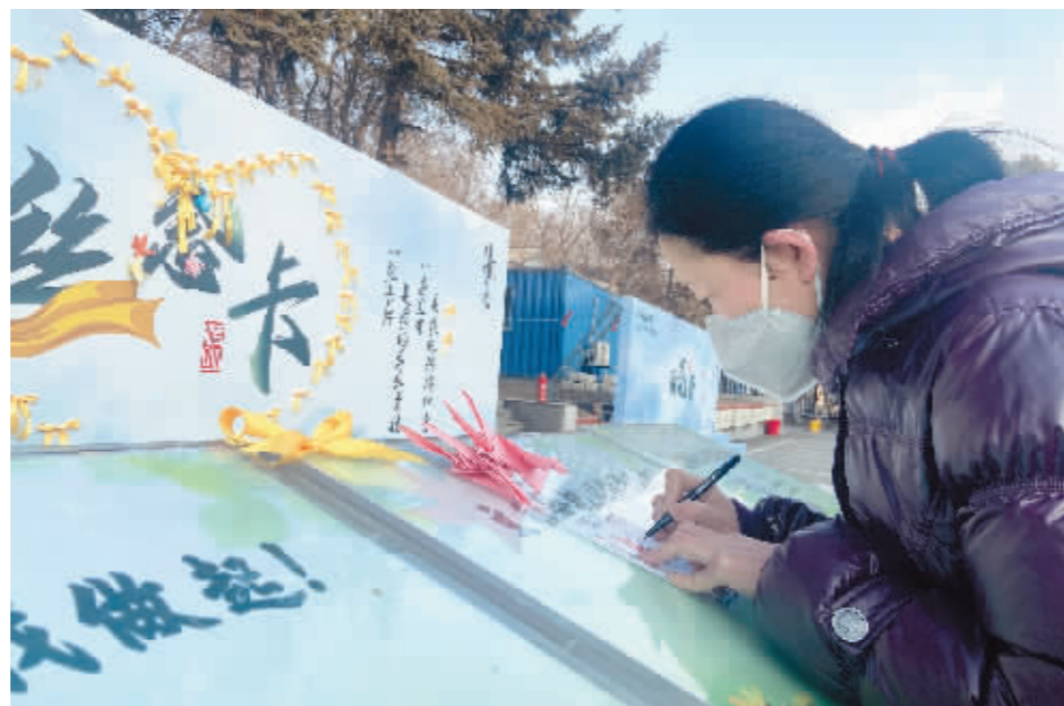
市民在卡片上写满对亲人的思念。

云祭英烈、生态海葬、志愿宣传文明祭祀、组织未成年人缅怀先烈等文明实践活动,在全市倡导文明祭祀,共建“绿色清明”,让清明节成为展示城市文明程度和公民道德素质的新窗口。