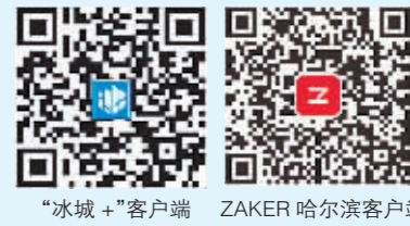
“冰城+”客户端 ZAKER 哈尔滨客户端