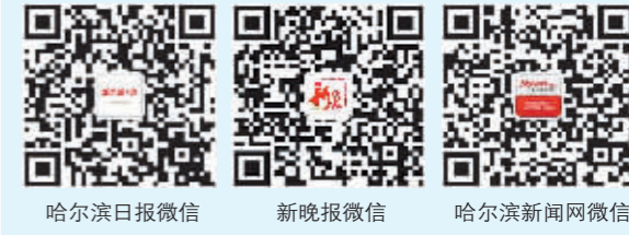
哈尔滨日报微信 新晚报微信 哈尔滨新闻网微信