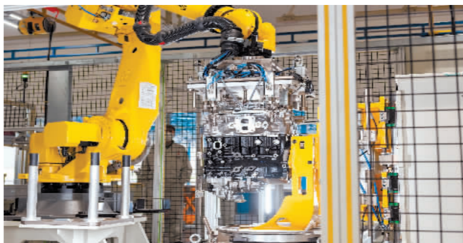
发动机装配机器人正在装备整机。

2023年伊始,宏观经济复苏,汽车行业迎来了新的发展机遇。东安动力充分发挥重组整合改革红利,充分发挥精益制造基地和“多品种、小批量”精益生产模式作用,海内外市场订单大幅攀升,3月份企业整机产量突破7万台。(下转第三版)