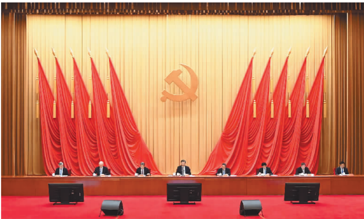
4月3日,学习贯彻习近平新时代中国特色社会主义思想主题教育工作会议在北京召开。中共中央总书记、国家主席、中央军委主席习近平出席会议并发表重要讲话。李强、赵乐际、王沪宁、蔡奇、丁薛祥、李希、韩正出席会议。